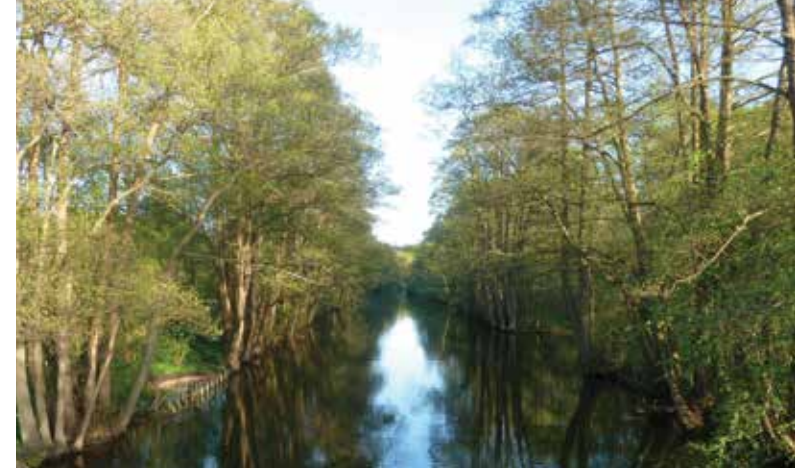
Et kig ned ad Mølleåen