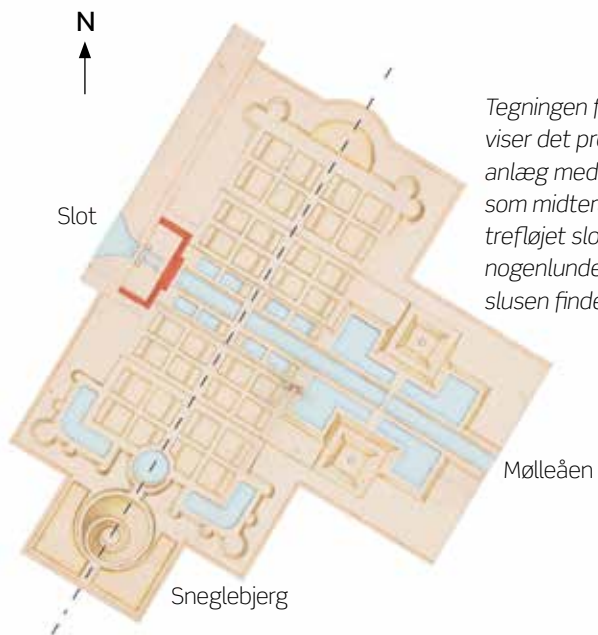
Tegningen fra 1669 viser det projekterede anlæg med Mølleåen som midterakse og et trefløjet slot placeret nogenlunde, hvor slusen findes i dag.