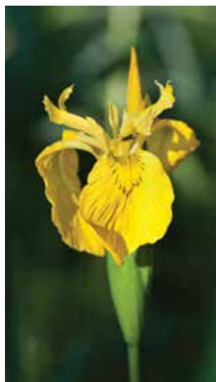
◀ Gul iris

Langs Furesøen og Bagsværd Sø skal foryngelsen ske jævnt over mindst 60 år for at bevare skovkarakteren. I Spurveskjulskoven ved Hummeltoftevej blev der i 2014 etableret et træklatringsanlæg til rekreativ brug for familier og institutioner m.m.